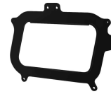
1 Adapterblech Adapter Bracket

Medium strength liquid thread-locker (i.e., "Loctite") should be used to secure all screws, bolts and nuts.