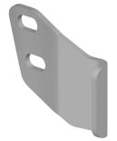
6 Vorspannwinkel Latch Hook